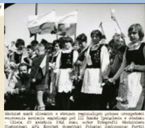
Stronki w mundurkach i strojach regionalnych podczas uroczystości wmurowania kamienia węgielnego przy III Liceum Ogólnokształcącym w Głogowie. 11 lipca 29 września 1948 roku, autor fotografii: Bogdan Kłoczyński. AINP, Emblemat Samodzielnej Politechniki Zielonogórskiej. Pamiątkowa broszura z okazji 40-lecia Związku, foto. 1987